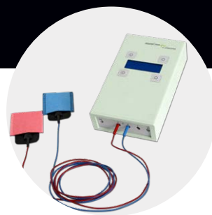
DC-STIMULATOR mit Schwammelektroden