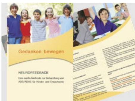
Flyer Neurofeedback "Gedanken bewegen"