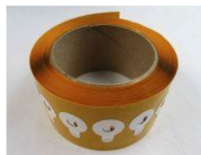
500 Kleberinge (EOG-Ableitung) (+ Adapter 905200-10)