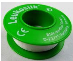
Pflaster (unsteril) 1 Rolle zu 5 m