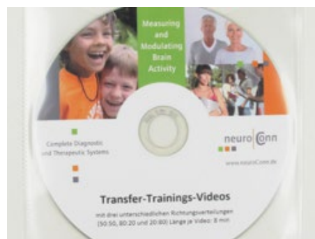
Transfer-Trainingsvideo, zum Heimtraining Bestellnr.: 905570