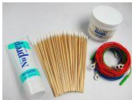
Startset für THERA PRAX ® QEEG