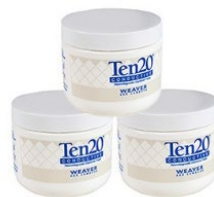
Elektrodenpaste Ten20 3 Dosen je 114 g