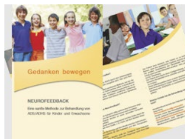
Flyer "Neurofeedback" zur Patienten- information Bestellnr.: 999910