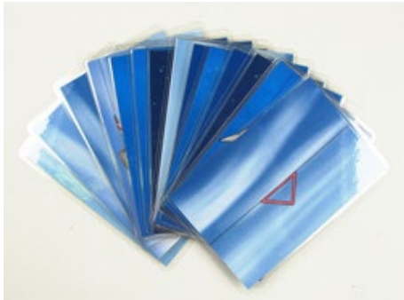
Trainingskarten für das Transfertraining zu Hause