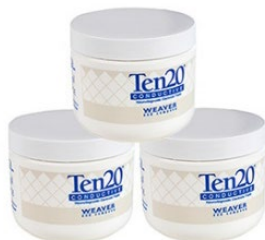
Elektrodenpaste Ten20 3 Dosen je 228 g