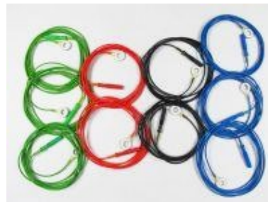
10 gesinterte Ag/AgCl-Ringelektrode (auch für EKG und EMG) Bestellnr.: 905110