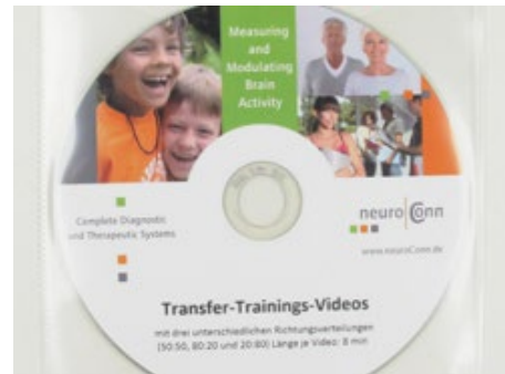
Transfer-Trainings-Video, zum Üben für zu Hause