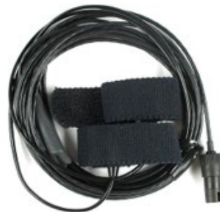
GSR-Sensor (galvanische Hautantwort)