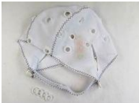
EEG-Elektrodenhaube THERA PRAX®, inkl. 14+4 Adapter für Ringelektroden, Kinnriemen

Alle Hauben sind in den Größen 52, 54, 56, 58 und 60 lieferbar. Bitte geben Sie bei der Bestellung die Größe mit an.