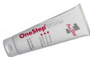
OneStep EEG-Gel 1 Tube 120g