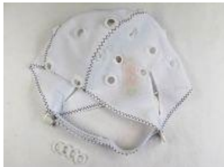
EEG-Elektrodenhaube THERA PRAX®, inkl. 23+4 Adapter für Ringelektroden, Kinnriemen