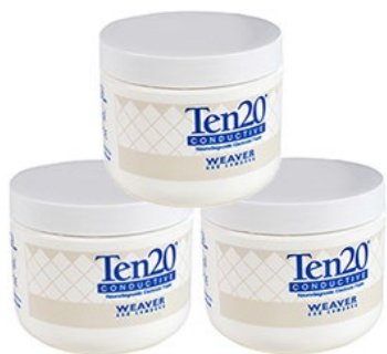
Elektrodenpaste Ten20 3 Dosen, je 228 g Bestellnr.: 905821