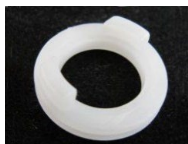
Elektrodenadapter (zzgl. Kleberringe 905910) Bestellnr.: 905200-10