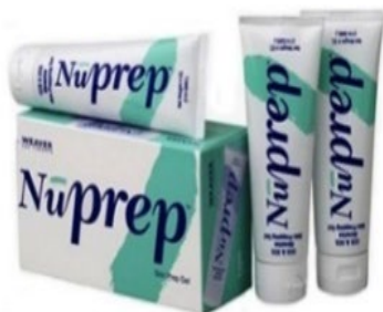
Abrasivepaste Nuprep, 3 Tuben, je 114 g Bestellnr.: 905830