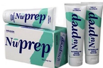
Nuprep abrasive paste 3 Tuben je 114 g