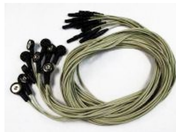
Druckknopf-kabel für EKG, 10 Stück