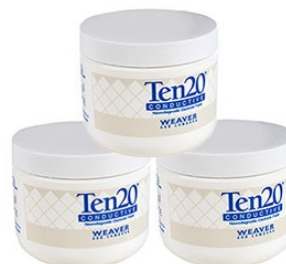
Elektrodenpaste Ten20, 3 Dosen, je 114 g Bestellnr.: 905822