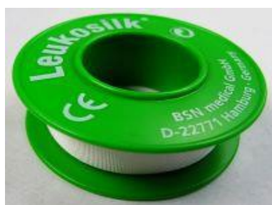
Pflaster (unsteril), 1 Rolle zu 5 m Bestellnr.: 905940