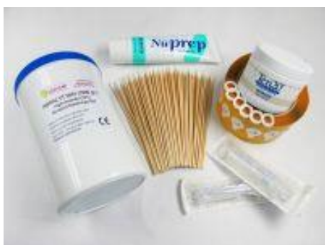
Start-Set-Hauben: ABRALYT, Ten20, Nuprep, Kleberinge, Wattestäbchen, Spritzen, 6 Adapter