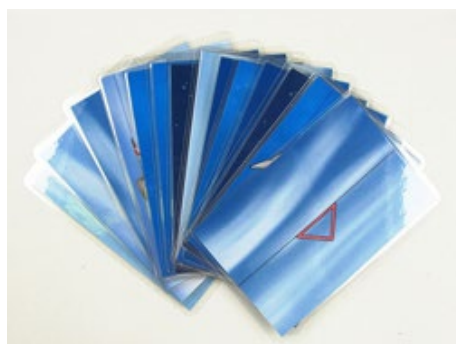
Trainingskarten zum Heimtraining Bestellnr.: 905550