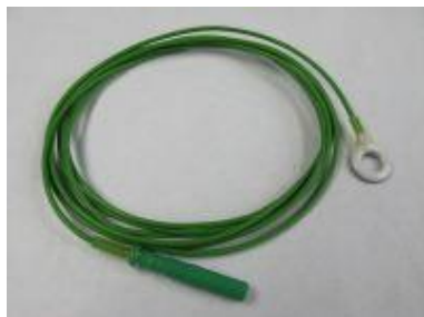
1 gesinterte Ag/AgCl-Ringelektrode (auch für EKG und EMG) Bestellnr.: 905105