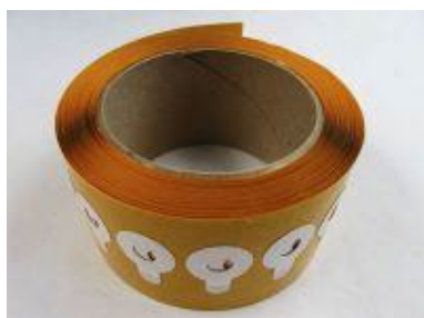
500 Kleberringe für EOG-Ableitung (mit Adaptern 905200-10) Bestellnr.: 905910