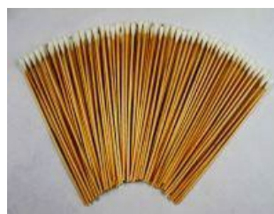
100 Wattestäbchen, lang (unsteril)