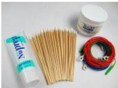
Startset für THERA PRAX ® MOBILE