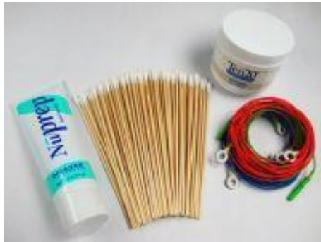
Startset für THERA PRAX® MOBILE (10 Elektroden, Ten20, Nuprep, Wattestäbchen) Bestellnr.: 905510

Darüber hinaus gehendes Zubehör finden Sie in den nächsten Tabellen.