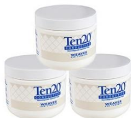
Elektrodenpaste Ten20 3 Dosen je 228 g