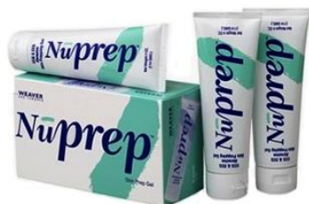
Nuprep abrasive paste 3 Tuben je 114 g