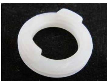
Elektrodenadapter für EEG-Haube (für EOG zzgl. Klebriinge 905910 - siehe Verbrauchsmaterial)