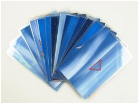
Trainingskarten für das Transfertraining zu Hause