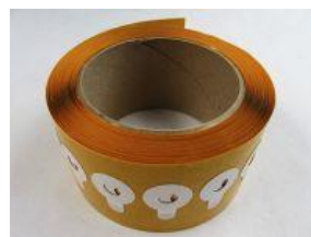
500 Kleberinge (EOG-Ableitung) (+ Adapter 905200-10)