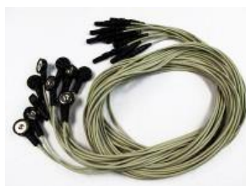
Druckknopf-kabel für EKG, 10 Stück