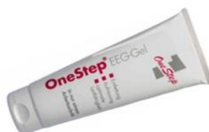
OneStep EEG-Gel 1 Tube 120g