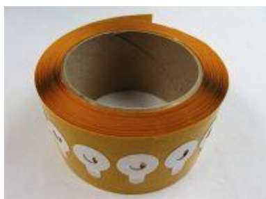
500 Kleberringe für EOG-Ableitung (mit Adaptern 905200-10) Bestellnr.: 905910