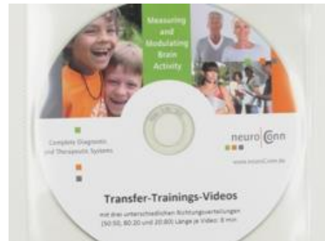
Transfer-Trainings-Video, zum Üben für zu Hause