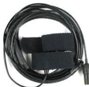
GSR-Sensor (galvanische Hautantwort)