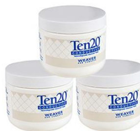
Elektrodenpaste Ten20, 3 Dosen, je 114 g Bestellnr.: 905822