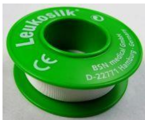
Pflaster (unsteril) 1 Rolle zu 5 m