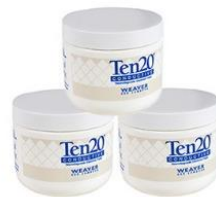
Elektrodenpaste Ten20 3 Dosen je 114 g