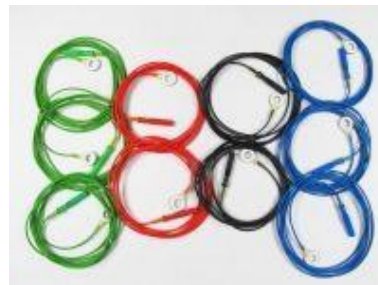
10 gesinterte Ag/AgCl-Ringelektrode (auch für EKG und EMG) Bestellnr.: 905110