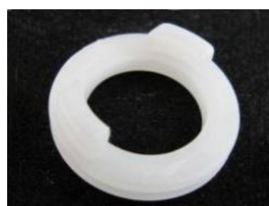
Elektrodenadapter (zzgl. Kleberringe 905910) Bestellnr.: 905200-10