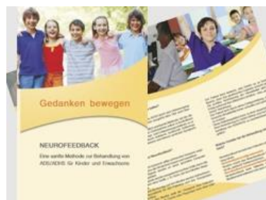
Flyer "Neurofeedback" zur Patienten- information Bestellnr.: 999910