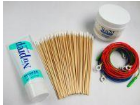
Startset für THERA PRAX® QEEG (10 Elektroden, Ten20, Nuprep, Wattestäbchen) Bestellnr.: 905515