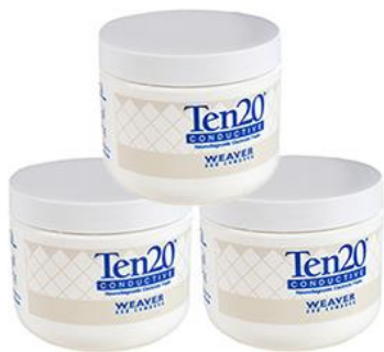
Elektrodenpaste Ten20 3 Dosen, je 228 g Bestellnr.: 905821