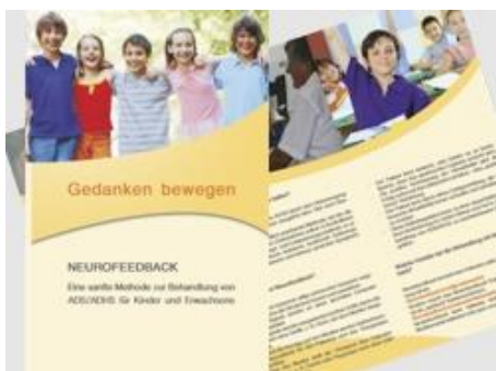
Flyer Neurofeedback "Gedanken bewegen"