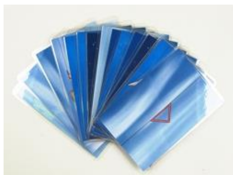
Trainingskarten zum Heimtraining Bestellnr.: 905550