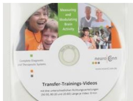
Transfer-Trainingsvideo, zum Heimtraining Bestellnr.: 905570